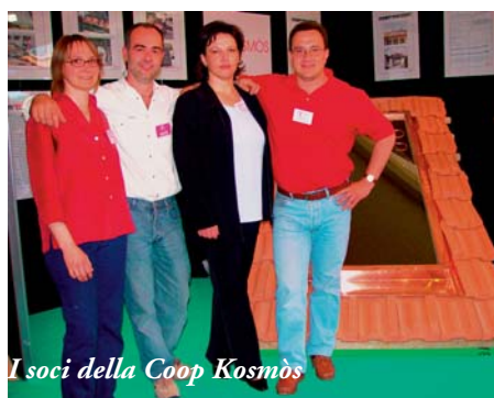
I soci della Coop Kosmòs

Per informazioni: Kosmòs scarl Tel 0461-659003 e-mail: coop_kosmos@hotmail.com.